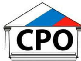
ООО «Сервисно-ремонтная компания (инженер, электрик, сантехник) (6 сотрудников)