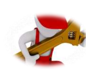
ООО "ТИС" сантехник