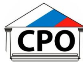
ООО «Сервисно-ремонтная компания» (инженер, электрик, сантехник)