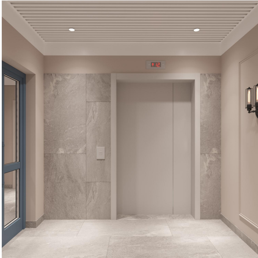
В торце помещения классический молдинг и настенное БРА