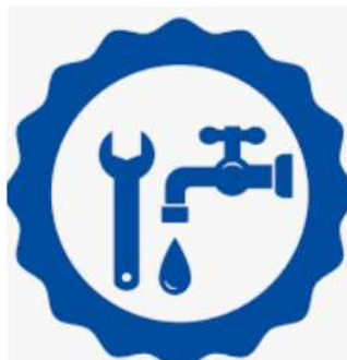
Рафаил Махмутов сантехник